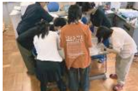
せっけんづくりワークショップ

今後も可能であれば継続して、卒業生より自分たちの就職先での活躍や後輩へのアドバイスなどを聞かせ