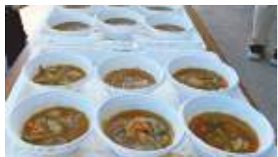
好評だったカレースープ

走った約500人に加え、PTAや地域の方々にもおすそ分け。最終的に650食の提供となりました。