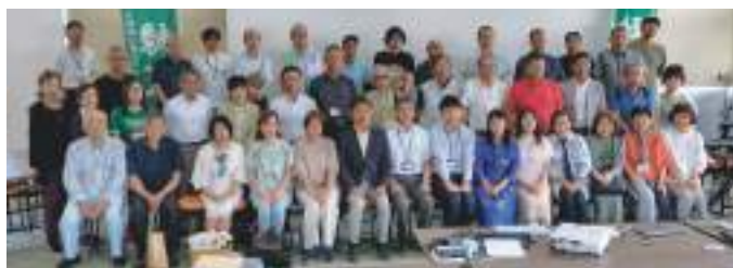
令和7年度緑友会総会閉会時の集合写真