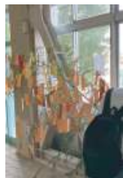
七夕イベントの笹と短冊