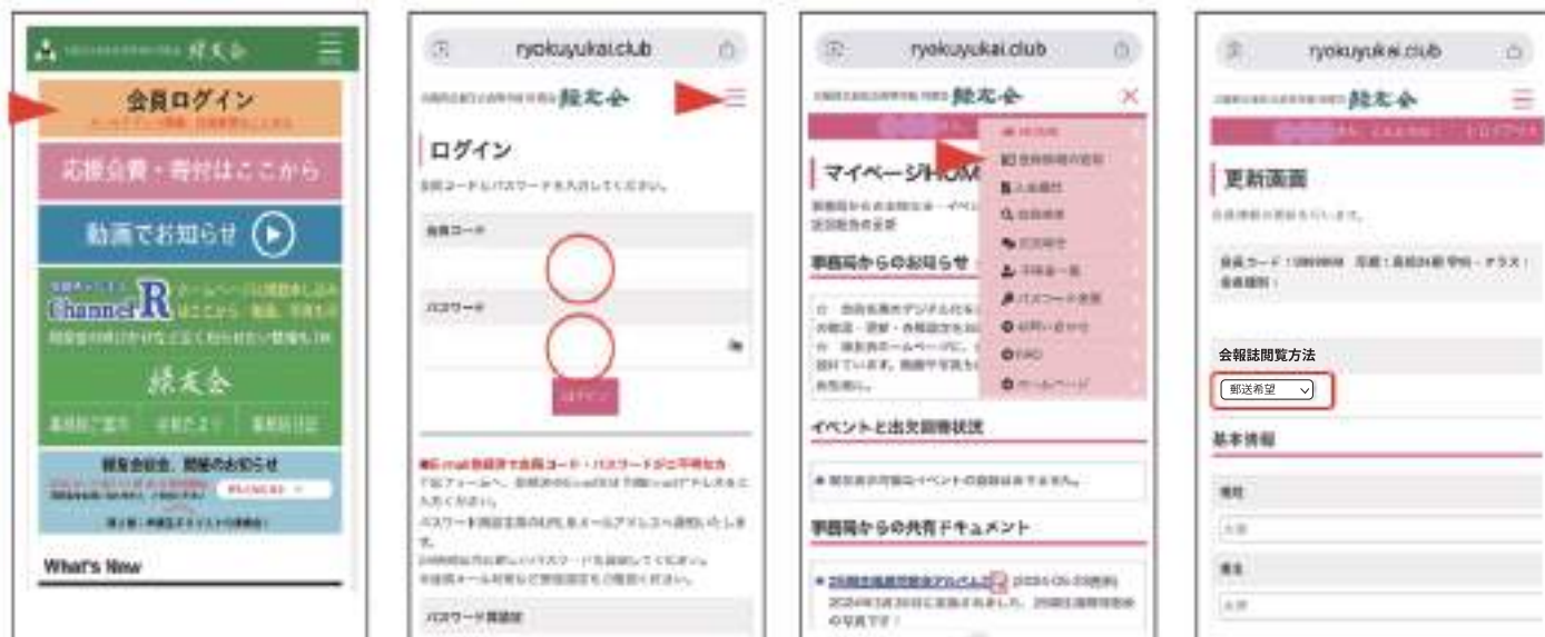
ホームページのホームで 会員ログインをタップ

※ログインの会員コード、パスワードがご不明の方は、緑友会事務局にメールでご連絡ください。 ホームページの「お問い合わせ」フォームからのメール送信が便利です。 同窓会システムのログイン画面にも「パスワード再設定」のご案内があります。